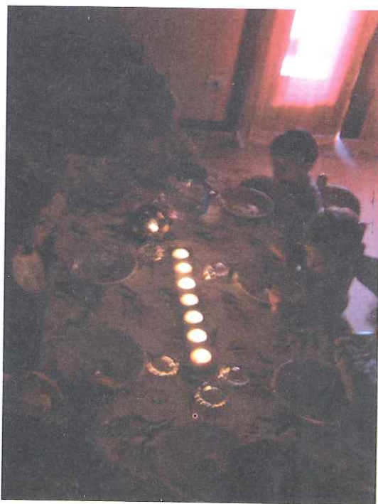
◀ Un gruppo di bambini della sezione "Mimeson" che sta gustando il pranzo a lume di candela ▶