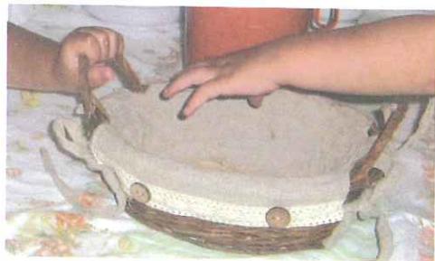
▲ Il gesto di condivisione del cestino del pane tra due bambini