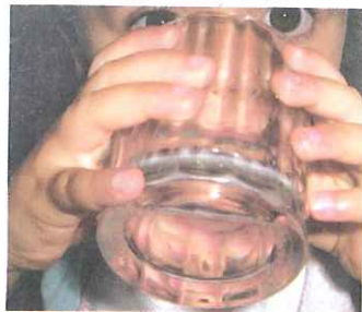
▲ L'abilità nel destreggiare con disinvoltura un bicchiere di vetro