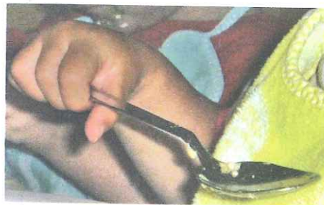
▲ La capacità di afferrare il cucchiaino e di portarlo alla bocca